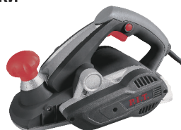
МОДЕЛЬ PEP006L-C2 PRO