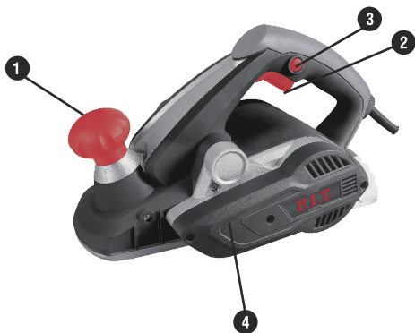
МОДЕЛЬ PEP006L-C2 PRO