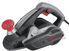
MODEL PEP006L-C2 PRO